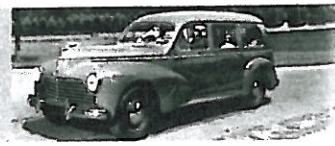
Ab 1948: Peugeot 203 Familiale

1968: Der 504 erscheint als viertürige Limousine. 1971: Kombivarianten Commerciale (Lieferwagen), Break (fünfsitziger Kombi) und Familiale (sieben bis acht Sitzplätze). 1975: Türgriffe in Karosserie eingelassen, neues Armaturenbrett. 1977: schwarzer Kühlergrill (Kunststoff statt Chrom). 1979: 504 Pick-up, Nachfolger 505 debütiert. 1983: Ende der 504-Auslieferung in Deutschland. 2005: Produktionsende in Nigeria nach über 3,7 Millionen Exemplaren.