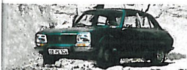
Ab 1968: Peugeot 504 Limousine