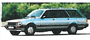
Ab 1982: Peugeot 504 Break