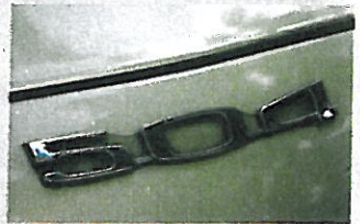
Eine gute Nummer für Frankophile

Chambre, chambre, wie der Franzose sagt – Gemach, Gemach: 504 Break und Familiale sind zwar selten wie guter Rotwein aus dem Tetrapack, doch es gibt sie und sie kosten nicht die Welt: maximal 7000 Euro für ein Top-Auto. Die Anzahl käuflicher Fahrzeuge und die der Interessenten halten sich die Waage. Selbst der natürliche Feind aller 504, der Afrika-Exporteur, hechtet keinem Exemplar mehr vor die Haube.